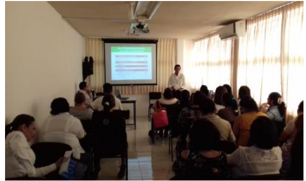
Dinámica: “Cómo Salir del Hoyo”