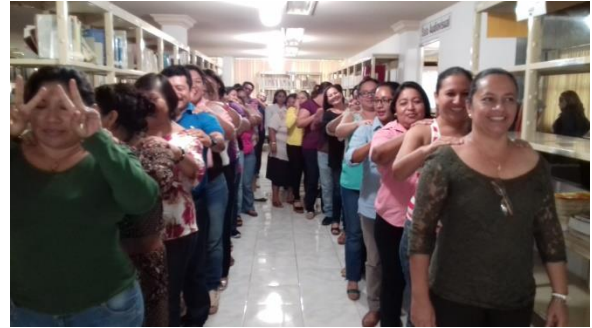
Foto del recuerdo de la “4ta. Jornada de Actualización Tutorial 2017”