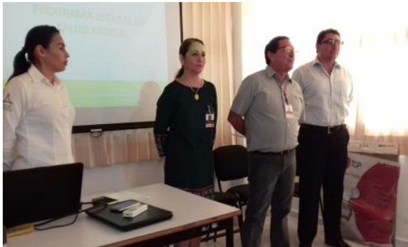
Dinámica: “Nudo Humano”